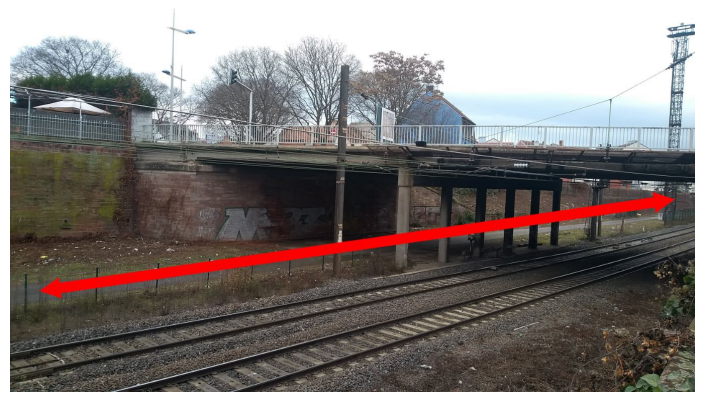
Chemin de service SNCF, venant de la rue du Chemin de fer (à droite). A gauche, le bâtiment marquant l'emplacement du projet Chartreuse.